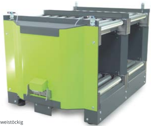
Box Carrier zweistöckig mit Rollenförderer