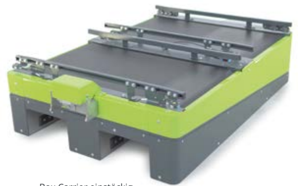
Box Carrier einstöckig mit Gurten